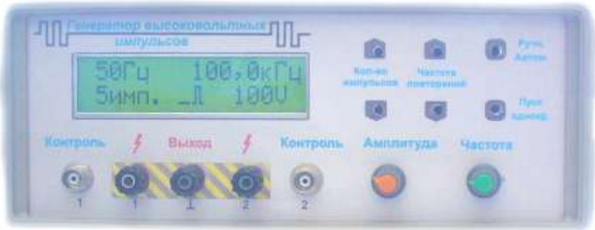
Рисунок 2 – Внешний вид передней панели