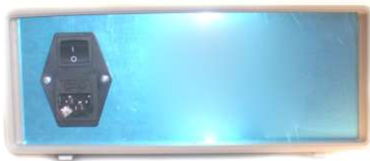
Рисунок 1 – Внешний вид задней панели

Конструктивно генератор выполнен в металлическом корпусе. Внутри корпуса размещены трансформатор и печатные платы. На задней панели (рис. 1) размещён узел фильтра, содержащий предохранитель, выключатель сети и разъём питания.