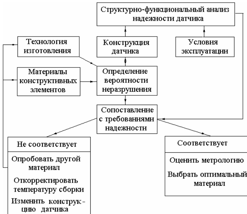
Рис. 4. Схема выбора материалов СПЭ.

В результате расчетов определяется группа материалов, применение которых в деталях СПЭ конкретного датчика для заданных условий эксплуатации обеспечивает необходимую механическую надежность конструкции. Очевидно, что чем шире диапазоны влияющих факторов, тем меньше будет круг этих материалов, тем в меньшей степени должны отличаться их КЛТР и упругие свойства от соответствующих свойств пьезокерамики. В дальнейшем из этой группы по известным рекомендациям [1,7,10,11] может быть выбран конкретный материал с учетом его влияния на чувствительность, быстродействие, виброэквивалент ПД, а также исходя из технологичности, доступности и т.д.