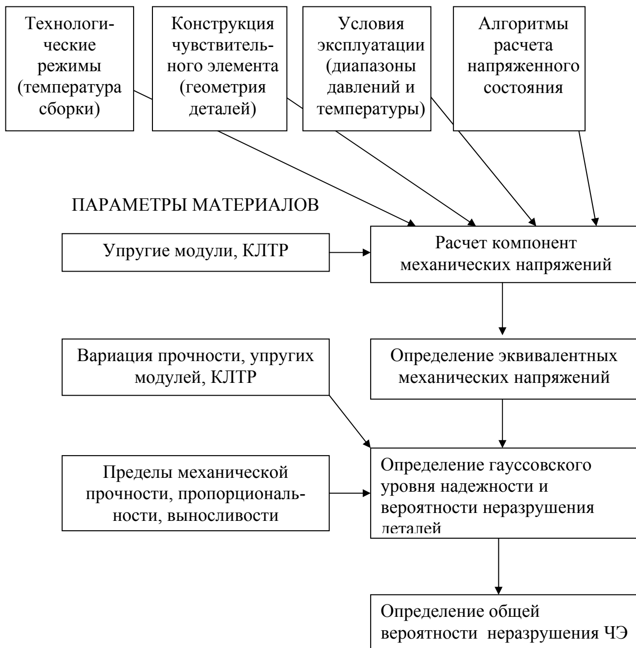
Рис. 1. Схема расчета механической надежности ЧЭ

4) Определить общую вероятность неразрушения ЧЭ или датчика в целом. В частности, если разрушение каждой детали ЧЭ может привести к выходу из строя датчика и потере информации, то механическая надежность ЧЭ Y будет равна произведению вероятностей неразрушения каждого элемента Y_k [1,3]: