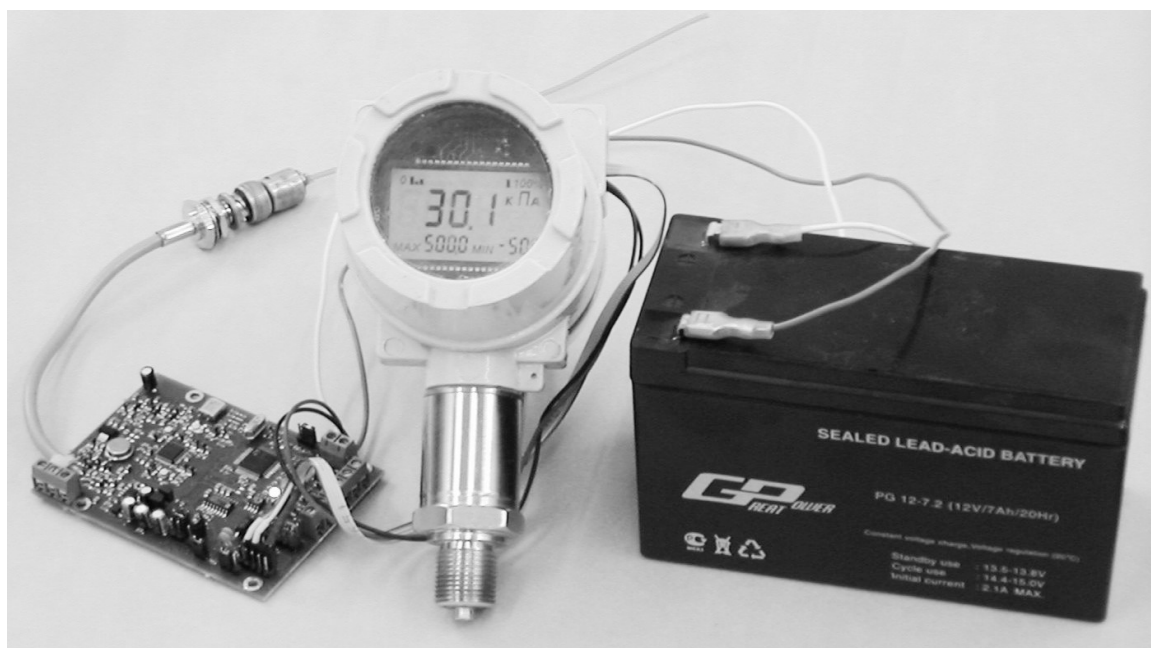
Рисунок 1. Внешний вид датчика давления, модема и источника питания.

На рисунке 1 показан внешний вид датчика давления, модема и источника питания, а на рисунке 2 схема их применения для беспроводной передачи информации.